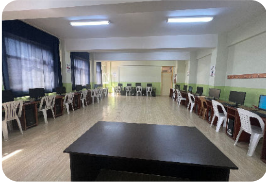
Bilgisayarlı Muhasebe Atölyesi